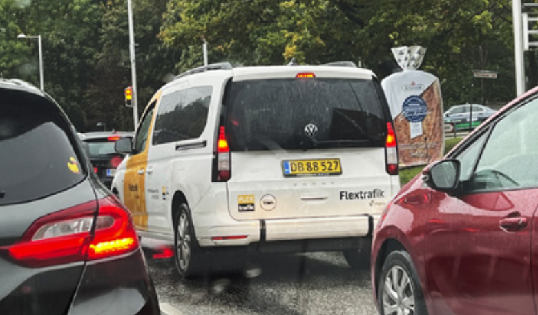
Movia og Nemlig.com ligner hinanden i det tilfælde, at de begge slår ud med armene og ikke vil påtage sig ansvaret for selve kørslen, men henviser til underentreprenører.

Trafikselskaberne i Danmark har efterhånden tilranet sig så stor en rolle, magt og markedsandele, at almindelige små og mellemstore transportforretninger ikke længere kan være med.