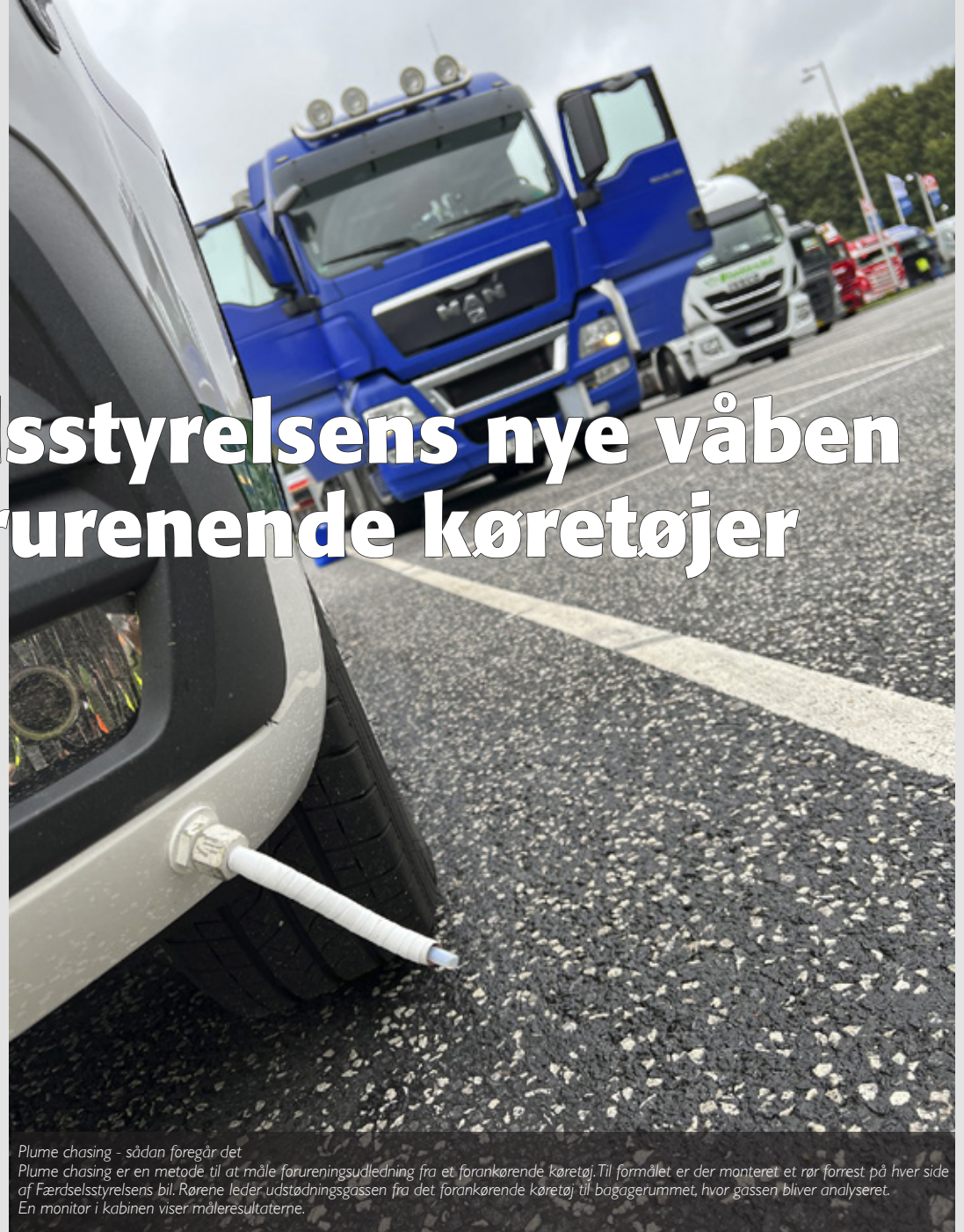
Plume chasing - sådan foregår det

Han er tydeligt imponeret over de mange resultater, som udstyret har vist på bare den første måned, udstyret har været i brug i Danmark og om kort tid får Færdsels-