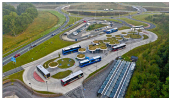
Trafikselskabet i Holland har siden implementeringen af hub-konceptet oplevet stor passagertilfredshed og støt fremgang i passagertallet.

Midttrafik har igangsat et arbejde med at identificere mulige lokaliteter i det kollektive net, som med fordel kan udvikles til udvidede knudepunkter - såkaldte hubs, hvor transportmidler som bl.a. flextrafik kan spille en stor rolle.