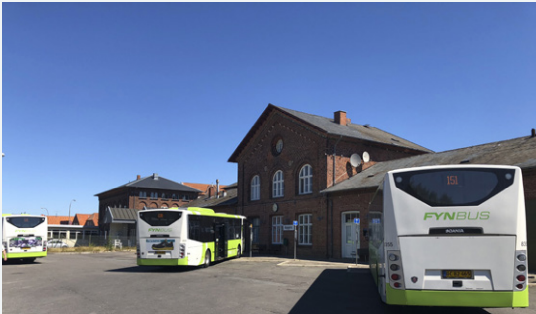
Også busserne der kører til og fra Assens bliver grønnere og mere klimavenlige.