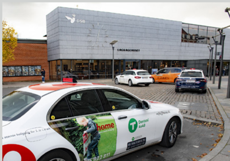
De første Dantaxi-biler holdt allerede i oktober 2019 ved banegården i Vejle

ne fra interesserede chauffører og vognmænd, som vil forsøge sig med en fremtid som vognmand i