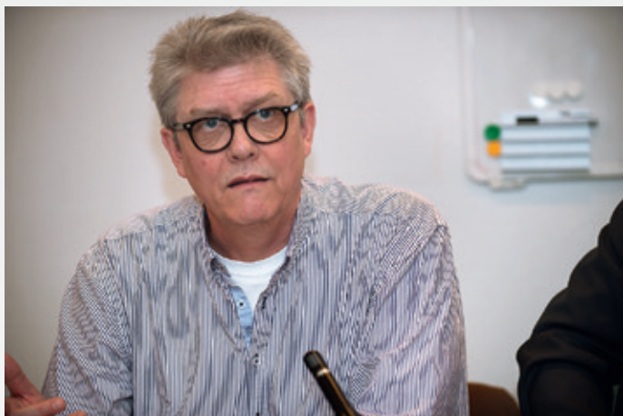
"Denne arbejdskamp handler om rettigheder og vilkår for ganske almindelige hårdt arbejdende lønarbejdere, men også samtidig for de vognmænd, der vil udføre deres erhverv på en ordentlig og seriøs måde på fair vilkår," fastslog Karsten Hønge (SF).