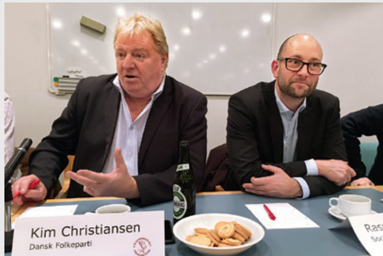
Kim Christiansen (DF) var - hvad han kaldte, foruroligende enig med sine politiske modstandere i denne sag om Uber. Rasmus Prehn (S) beklagede, at der tidligere har været Socialdemokrater, der har udtrykt sig positivt omkring Ubers tilstedeværelse i Danmark.

Der er også andre problemer som spørgsmålet om, hvor er Uber hjemmehørende og er der overhovedet dansk straffekompetence, hvis Uber-virksomheden, der styrer app'en, ikke er