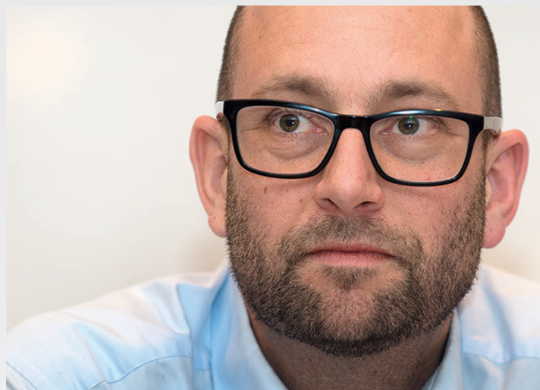
"Uber er systematisk organiseret pirattaxi, hvor man prøver at underminere de løn og arbejdsvilkår, vi har i Danmark," sagde Rasmus Prehn (S).

"Vi ser også Uber som systematisk organiseret pirattaxi, hvor man prøver at underminere de løn og arbejdsvilkår, vi har i Danmark. Jeg synes, det er vigtigt, at politiet får klaret de her sager af, fordi det for mig at se, er i strid