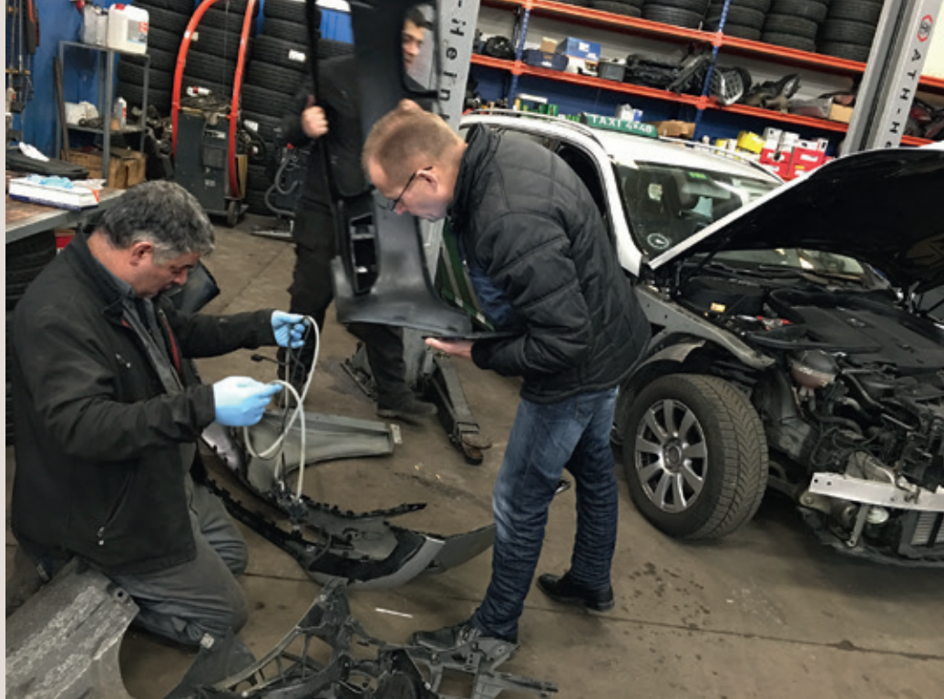
Hikmet har taget imod taksatoren og gennemgår bunkerne af knuste dele, mens taksatoren noterer ivrigt på sin iPad.