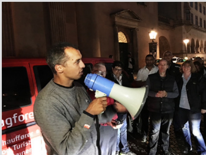
Socialdemokratiet frygter, at i er de første og at der er nogle andre, der bliver de næste, advarede Mattias Tessfaye.

Danmarks justitsminister til at give nogle instruktioner til politiet om at tage problemet alvorligt og få afsat de ressourcer, der skal til. Det skal ikke forstås som en kritik af politiet, men af Justitsministeriet og Rigspolitechefen.