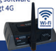
med 3G/4G Wi-Fi router