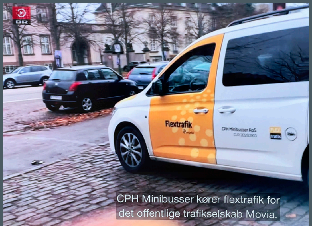
CPH Minibusser kører flextrafik for det offentlige trafiksselskab Movia.

kroner i samme periode, som der blev kanaliseret 3,4 millioner kroner gennem fakturafabrikken i Kolding.