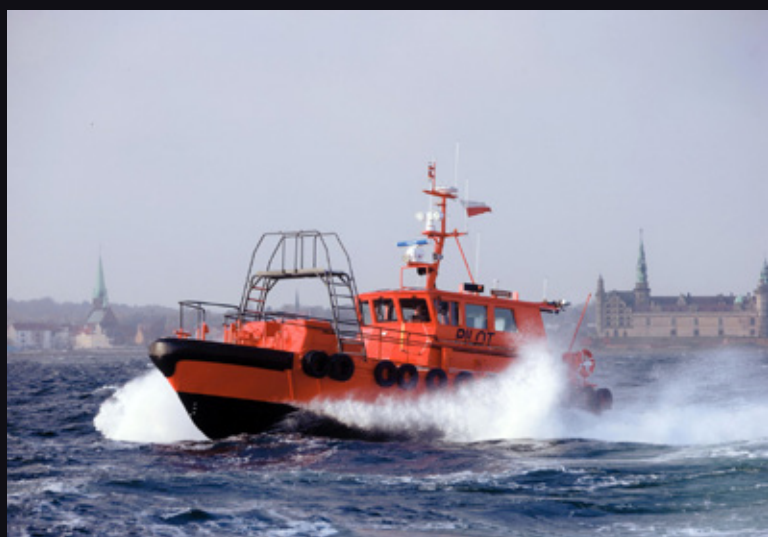
Kørsel for Danpilot har netop været i udbud. Taxi 4x27 vandt Nordjylland. Taxa Syd vandt resten af landet.

"Det er gode lange ture og vognmændene er meget tilfredse. Det er først gang, at vi byder ind på kørselsopgaver siden vi blev købt af Cabonline og det er nu bevist, at dialog om prisen med vognmændene virker. Prisen vi bød ind med over for Danpilots var aftalt med vognmændene i Frederikshavn. At vi vandt kørslen fortæller mig, at vores koncept om dialog med vognmændene om udbud virker. Det viser også, at vognmændene har indflydelse på deres hverdag, selv om selskabet er ejet af et stort nordisk taxiselskab. Vi kan stadig beholde