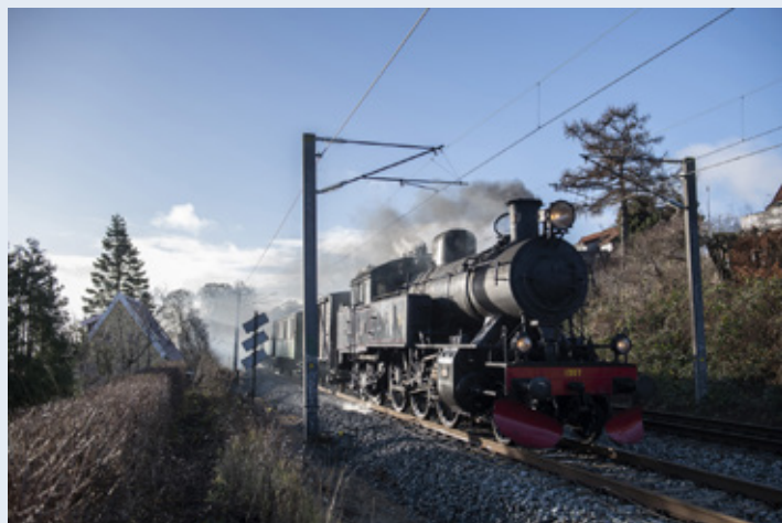
En ny jernbane over Vestfyn vil betyde kortere rejsetid for passagererne, ligesom den både vil bidrage til at effektivisere og modernisere banenettet og samtidig sikre mere robusthed i togsystemet ved sporarbejde og nedbrud.

Den nye bane over Vestfyn vil reducere rejsetiden for persontog i kraft af fire kilometer forkortelse af jernbanestrækningen og muligheden for at køre med op til 250 km/t. Samtidig vil den nye jernbane frigøre kapacitet på den nuværende jernbane over Vestfyn, og dermed giver den bedre mulighed for afvikling af især regional persontogstrafik på