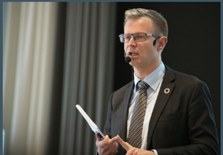
Transportminister Benny Engelbrecht står i spidsen for et grønt ministerie.

Ministeren påpegede, at der er tre væsentlige områder, der kan bidrage, når det handler om CO 2 -reduktioner. Det er boliger, landbruget og transport. Bilerne