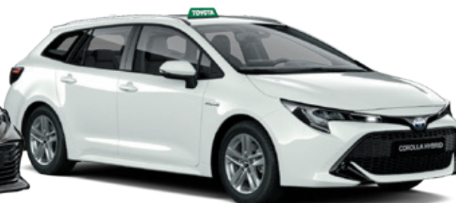
Corolla Touring Sports