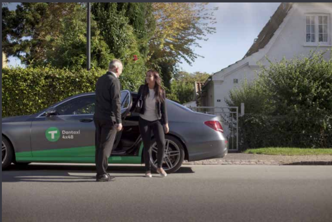
Dantaxi 4x48 udfører allerede taxikørsel i de fleste større byer, men udvider nu for alvor til landdistrikterne.

"Aftalen vil styrke landtaxivognmanden, der nu kan høste de samme stordriftsfordele, som tidligere har været forbeholdt vognmænd i byerne. Vi har vist, at vi