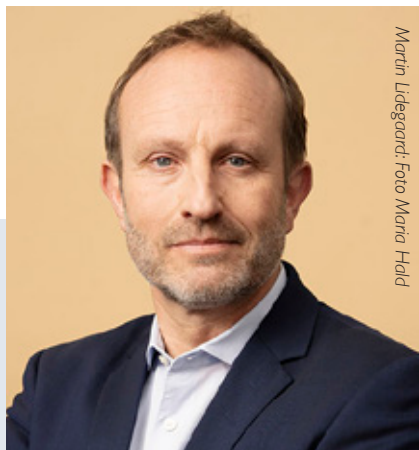
Martin Lidegaard