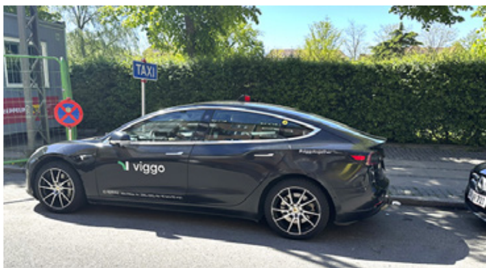
"Jeg måtte henvende mig syv gange til taxiselskabet Viggo før der skete noget og få dage senere var den gal igen", fortæller Toseef Elahi!