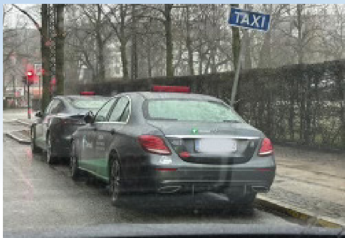
Ved Enghave Plads holder der ofte mere end 2-3 parkerede biler i en plads, hvor der normalt kun er plads til to hyresøgende biler.