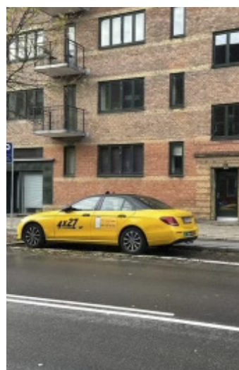
"Taxi 4x27, Dantaxi og TAXA 4x35 er hurtige til at reagere, når jeg kontakter dem om parkerede biler i taxiholdepladserne", fortæller Toseef Elahi.

Toseef Elahi opfordrer sine kolleger til at sende billeder af parkerede taxier i taxiholdepladser til taxiselskaberne med info om hvor bilerne holder.